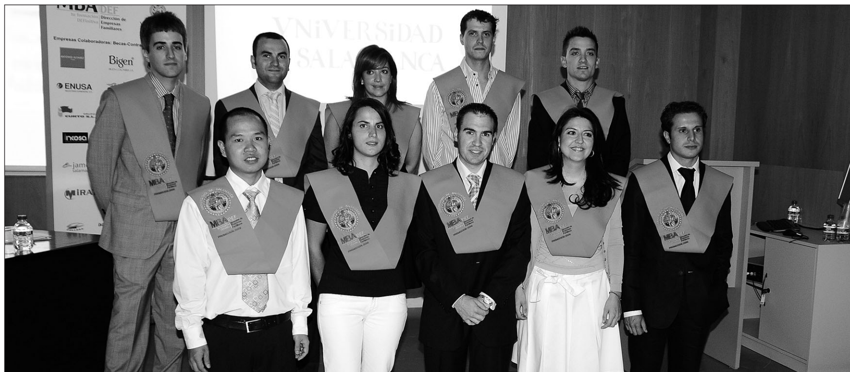
Los alumnos de la primera promoción del Máster en Dirección de Empresas Familiares posan con las bandas que recibieron ayer