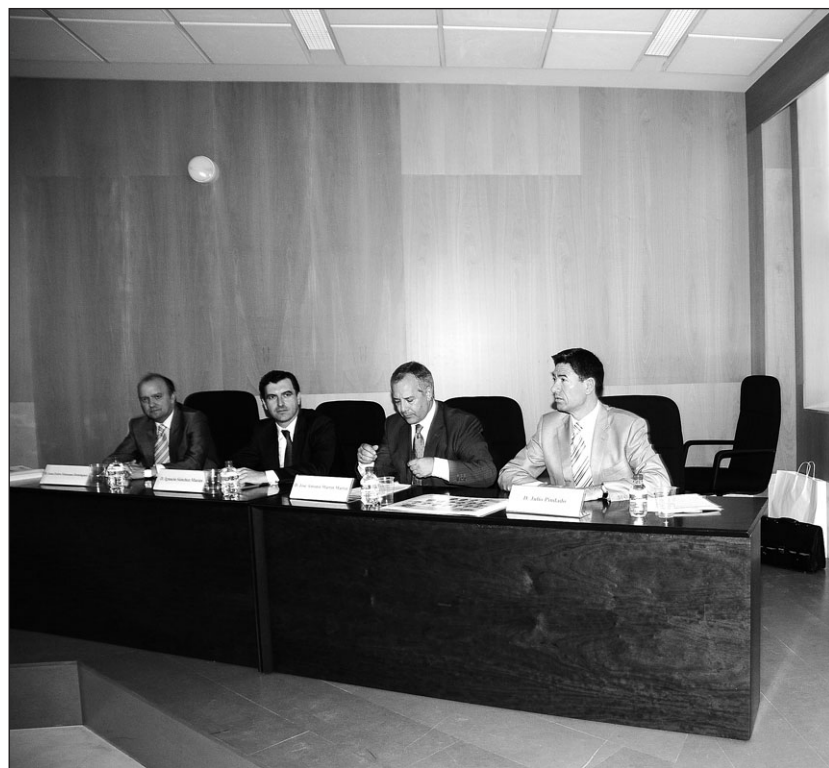
Los representantes de Empresa Familiar, Grupo Santander, Usal y la Cátedra

Con este positivo balance culmina el primer periodo de un Máster que el próximo curso reforzará la formación pionera que ofrece a los titulados universitarios con un módulo en inglés orientado a los negocios (business english) y otro de preparación enfocada a la consecución de metas (coaching). Asimismo, se consolidará la participación de escuelas de negocios (business school), que ya ha comenzado este año. Así se explicó durante el acto de imposición de bandas a la primera promoción de alumnos que acogió ayer la Facultad de Economía y Empresarial. El acto coincidió con el Día de la Empresa Colaboradora que organizó el Máster para reconocer el apoyo de las empresas y asociaciones profesionales a este programa formativo en todos sus ámbitos, desde la docencia hasta la concesión de becas, premios, prácticas remuneradas y contratos, lo que supone un acercamiento efectivo entre la universidad y la empresa. De hecho, en el transcurso del mismo se